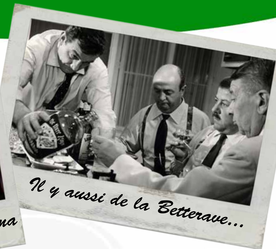
Il y aussi de la Betterave...