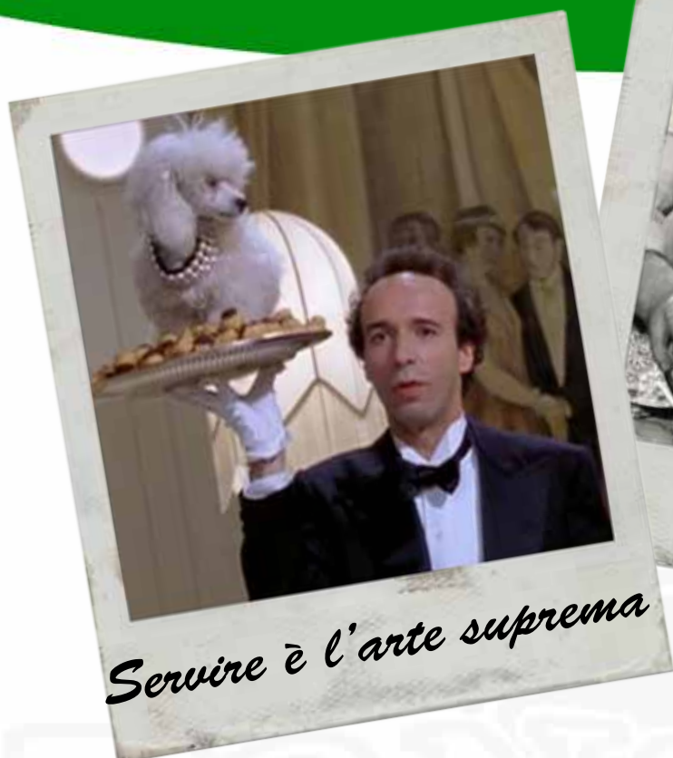
Servire è l'arte suprema