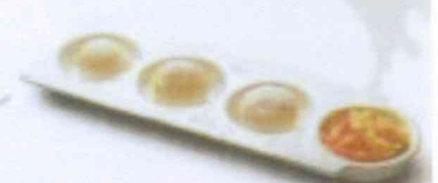
Boules de coco