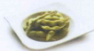
Germes de soya