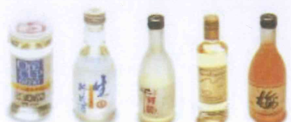
Saké, Sushiwine et liqueur de prune