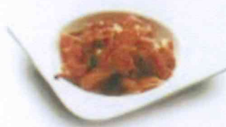
Salade d'algues et calamars