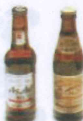
Bières Asahi et Kirin