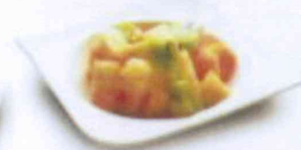
Salade de fruits frais