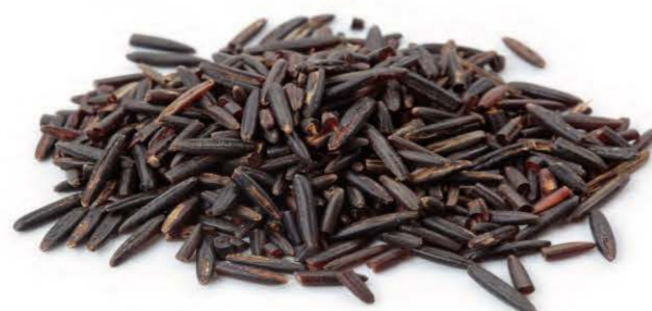
Dark Wild Rice