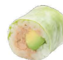
Spring Rolls Thon Cuit Avocat