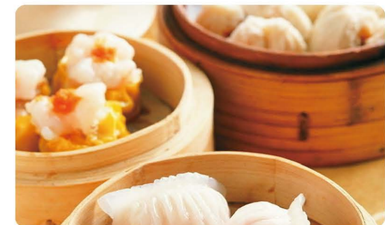
16 Diam Sum Mixtes à la Vapeur (5Pièces) A Mix of Steam Boiled Diam Sum 8.00 € A, B, C, G, N

Les plats vient par rapport à la photo représentée ci-dessus. Photos non contractuelles