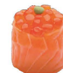
Oeuf de Saumon