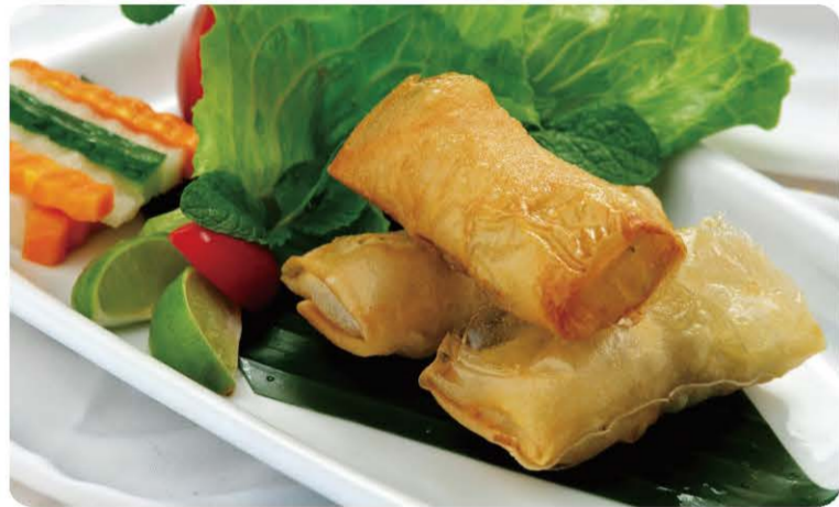
10 Nêms Nêms 6.80 € A, C, D, F, N, O