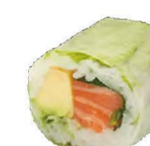
Spring Rolls Saumon Avocat