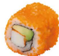
California Surimi Avocat