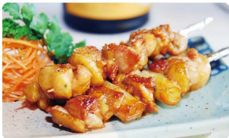
11 Brochettes de Poulet Grillée Bits of Roasted Chicken Dressed on a Wooden Stick 5.50 € A, F, O