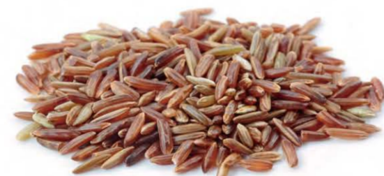
Red Cargo Rice