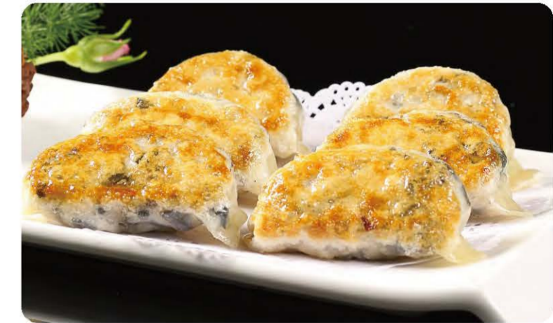
14 Raviolis Grillée (Poulet) Ravioli ( Chicken ) 8.90 € A, F, N, O