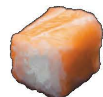
Rolls Saumon Cheese