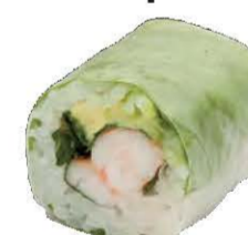
Spring Rolls Crevette Mangue