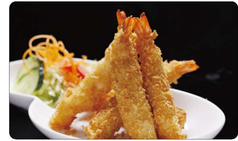
13 Tempura aux Scampis (5pièces) Fried Scampi ( 5 pieces ) 15.00 € A, B, C, N