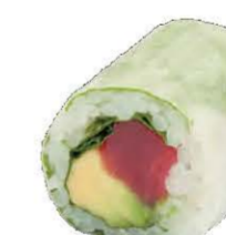
Spring Rolls Thon Avocat