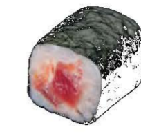
Maki Tuna Spalci