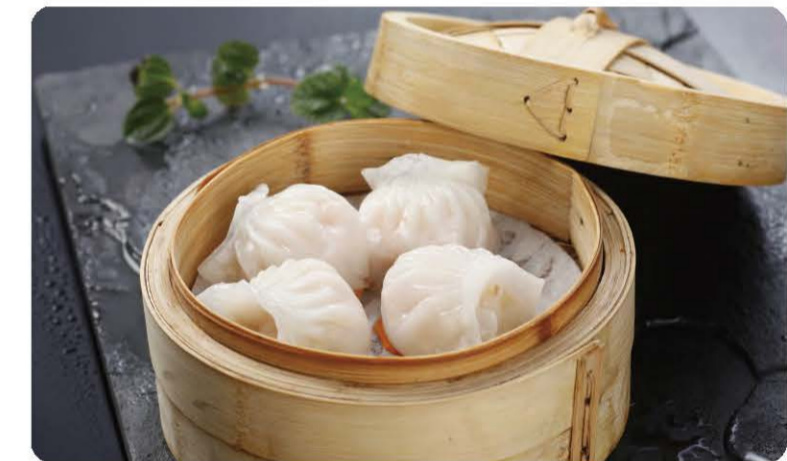
15 Raviolis au Scampis à la Vapeur (4Pièces) Ravioli of Steam Boiled Scampi 6.00 € B