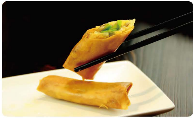
9 Croquettes Croquettes 5.50 € A, F