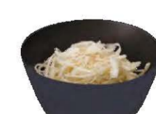
Salade de Choux