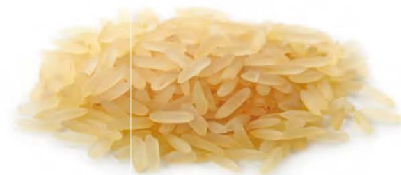
Parboiled Long Grain Rice