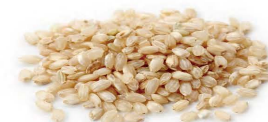
Brown Short Grain Rice

Les plats vient par rapport à la photo représentée ci-dessus. Photos non contractuelles