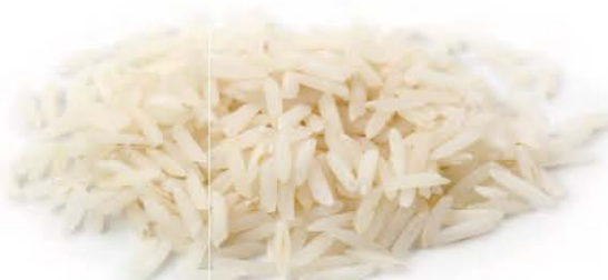
White Jasmine Rice