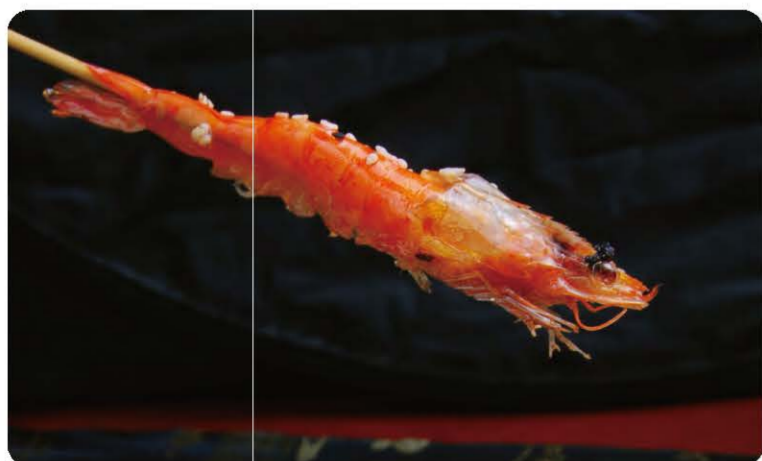
12 Brochettes de Gambas Grillée Roasted Gambas dressed on a Wooden Stick 6.80 € A, B, F, O